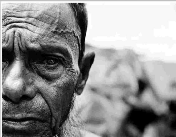
Tierra de nadie ▲ Constantine ha seguido la evolución de muchos de los retratados, como este rohingya. "Su situación no ha mejorado desde 2006", lamenta.

GENTE DE NINGUNA PARTE. Sala de exposiciones BBVA. Pº Castellana 81. 19 de oct. al 6 de noviembre. Mar.-sáb. de 11 a 20h.