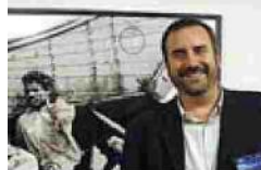
Greg Constantine FOTÓGRAFO

● ● ¿Qué hacía antes de iniciar este proyecto? Empecé con la fotografía en 2003 en Los Ángeles, donde vivía, retratando a presas. En 2006 me mudé a Asia. ● ● Para captar apátridas... No sabía nada de apatridia. Me parecía un concepto intangible y quise ilustrarlo con rostros de seres humanos. ● ● ¿Qué le cautivó? Que los apátridas, incluso las mujeres y los niños, no están