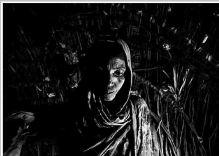
Ni somalí ni keniana ▲ En los noventa Kenia retiró su documentación a los galjeel, dentro de un proceso para detectar a inmigrantes somalíes. Como a esta mujer, apátrida y madre de apátridas.