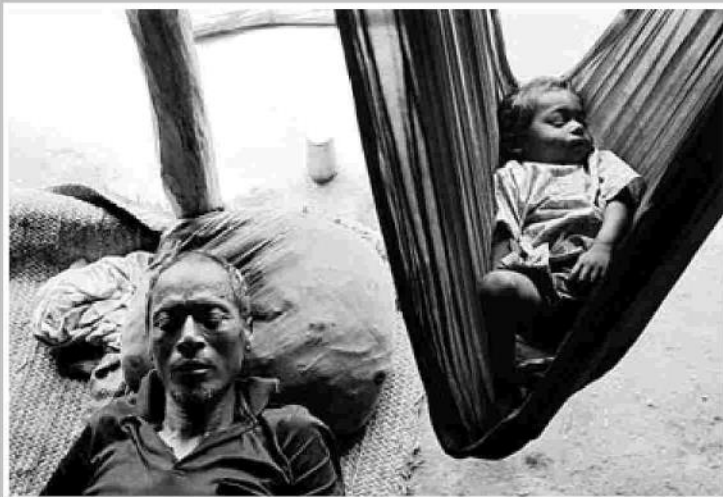
Cinco generaciones ▲ Un abuelo y su nieto descansan en Terai (Nepal). Aunque cinco generaciones de la familia han vivido allí, ninguno de sus miembros ha logrado la nacionalidad nepalí.