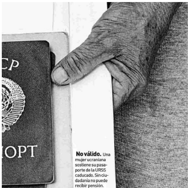
No válido. Una mujer ucraniana sostiene su pasaporte de la URSS caducado. Sin ciudadanía no puede recibir pensión.