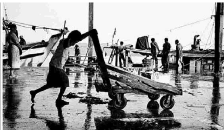
Subsistir en Sabah ▲ Los niños perdidos de Malaisia no saben qué es un documento de identidad, pero sí qué es trabajar. Sobreviven en el mercado cargando pesos que multiplican el suyo.