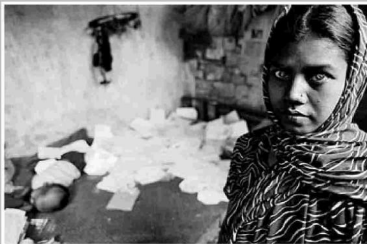
La esposa equivocada ▲ A los 20 años esta joven hablante de urdu y casi ciega ha sido abandonada por su marido. La ha dejado por una bangladesí con la esperanza de lograr la nacionalidad.