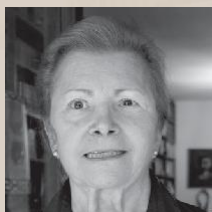
LIBERTAD (España) ¿Por qué repetimos la historia?