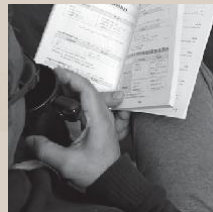
KARIM (Siria) 12 países en 10 días esquivando la muerte