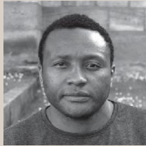
NYATHIERRY (Camerún) Un cuerpo lleno de heridas y golpes