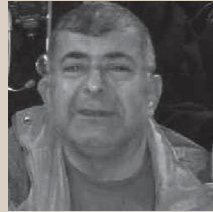
ALADÍN (Siria) Rescatado de la muerte en el mar