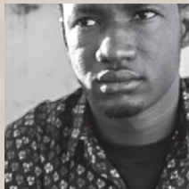
IBOUN (Mali) Huir de la yihad y vivir en la incertidumbre