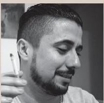
MORAD (Marruecos) El amor no es un delito