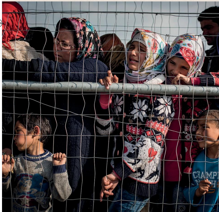
Idomeni (Grecia)