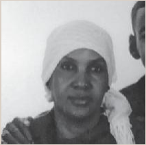
SULEIKA (Somalia) Para que sus hijos no fueran niños soldado