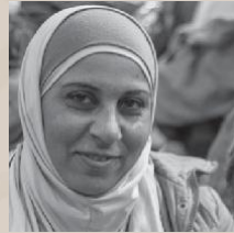
ZEINAB (Siria) La vida en una manta gris