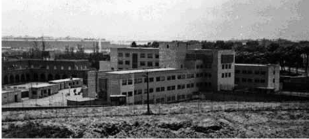
Imagen del viejo Hospital Penitenciario de la Cárcel de Carabanchel.

No obstante, hay un dato importante a la hora de sostener el paralelismo entre pasado y presente del lugar, y es que, observando las fotografías del antiguo Hospital Penitenciario y conociendo el funcionamiento del nuevo espacio, parece quedar claro que la mayor parte de las remodelaciones realizadas han sido destinadas a las dependencias de la comisaría de Latina y la Brigada Provincial de Extranjería.