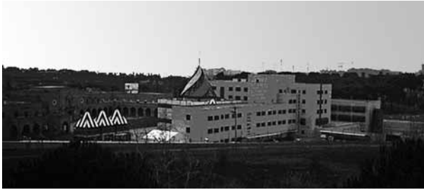
Imagen del CIE de Aluche y dependencias de la Brigada Provincial de Extranjería.